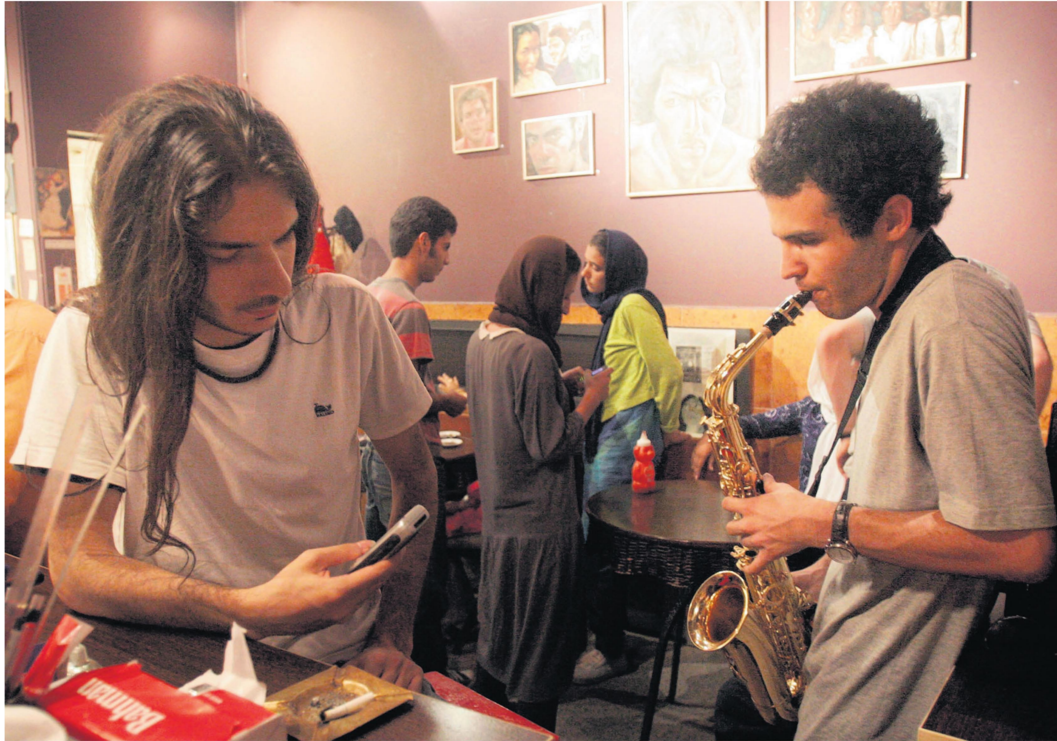
Een café in Teheran. Iraanse jongeren zijn vaak meer gericht op het Westen dan de oudere generaties.

Het resultaat is een paradox: op straat en op de universiteit achten jongeren zich verplicht zich als vrome moslims te presenteren. Binnenshuis, en op andere plaatsen